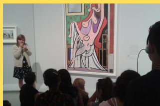
Exposition Picasso Musée Fabre juin 2018